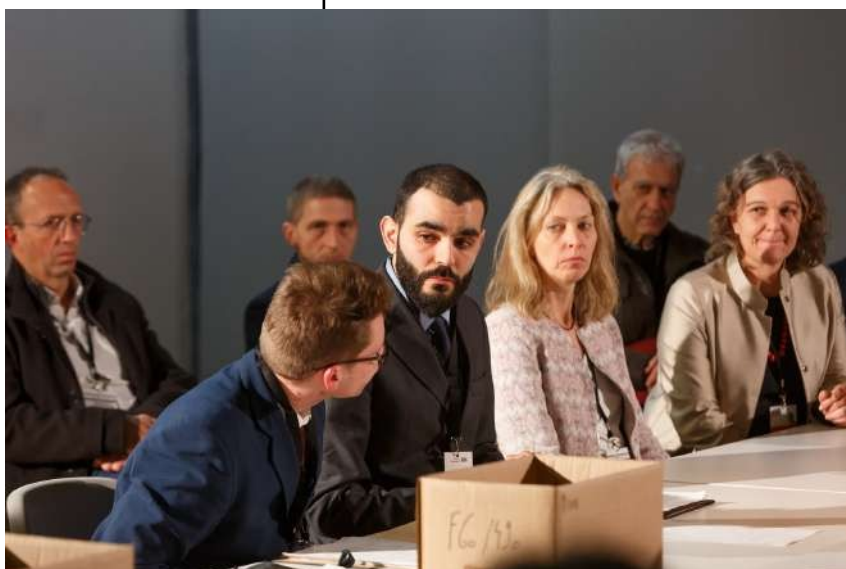
15 mars 2022, Centre Pompidou

Deux années de rencontres et de conférences, de master-class, d'études de documents ont donné naissance au projet « Jouer l'archive, octobre-décembre 1940 » où s'incarnent les minutes d'une réunion de décembre 1940, à Vichy, sur l'application du « statut des juifs » en France.