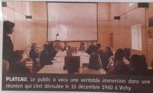
PLATEAU. Le public a vécu une véritable immersion dans une réunion qui s'est déroulée le 16 décembre 1940 à Vichy.

Tous discutent des modalités de mise en application de la loi du 3 octobre 1940 portant sur le statut des juifs. Elle stipulait que toute personne désignée comme « israélite » se verrait exclue de la fonction publique. Des mots durs, « définition de la race juive », « fonctionnaires douteux » et même « élimina-